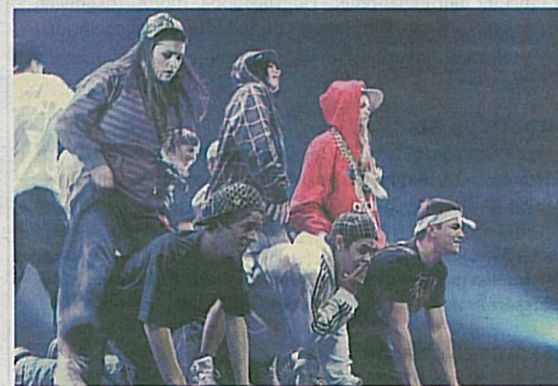
Den rappande tjejtrion red ut på sina dansare till publikens jubel.