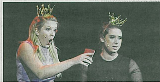
Prinsessan Madeleine och kronprinsessan Victoria diskuterade länge innan de vågade tugga på grodorna som lät "brats" istället för "kvack, kvack".