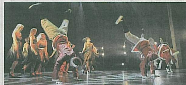
Både tomten och nissarna visste hur man skulle svänga på benen, stå på händerna och snurra på breakdancevis.